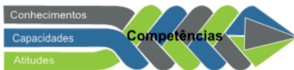
Figura 2 – Esquema conceitual de competência, do projeto 2030 da OCDE (adaptado).

As competências são combinações complexas de conhecimentos, capacidades e atitudes, são centrais no perfil dos alunos, na escolaridade obrigatória. A Figura 2 ilustra este conceito salientando a interligação das três dimensões.