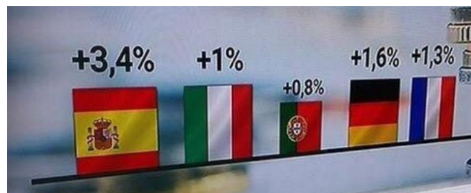
Crescimento Económico do 1.º trimestre de 2016

Propor a análise de gráficos selecionados que contenham manipulações e incentivar a sua identificação e os efeitos obtidos, promovendo o sentido crítico dos alunos [Exemplo: