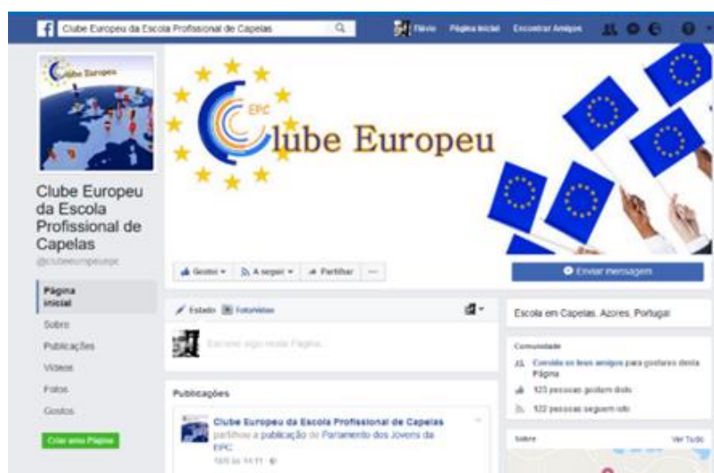
Visão geral da página do Facebook do Clube Europeu da Escola Profissional de Capelas