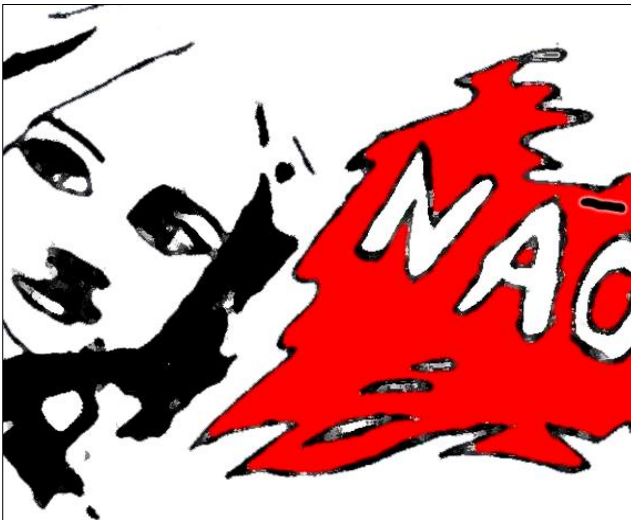
Imagem: Cartaz que acompanhou a iniciativa Os Sem Abrigo e a Arte. Autoras: aluna Filipa Ribeiro (7.º J) e Dra. Paula Fidalgo (grafismo). ES de Carvalhos/PNC - 2017

Neste número retomamos a divulgação dos planos de atividades das escolas integradas no PNC. Destacamos duas experiências em que a inclusão e o cinema se associam em torno de projetos pedagógicos muito comprometidos com problemas reais; recapitulamos as experiências cinematográficas que decorrem no AE de Ovar Sul; fazemos referência ao Cine-Eco, em Seia, um Festival inteiramente dedicado ao Cinema Ambiental, em crescente articulação com escolas, e damos conta das próximas sessões de cinema gratuitas para escolas no âmbito do PNC.