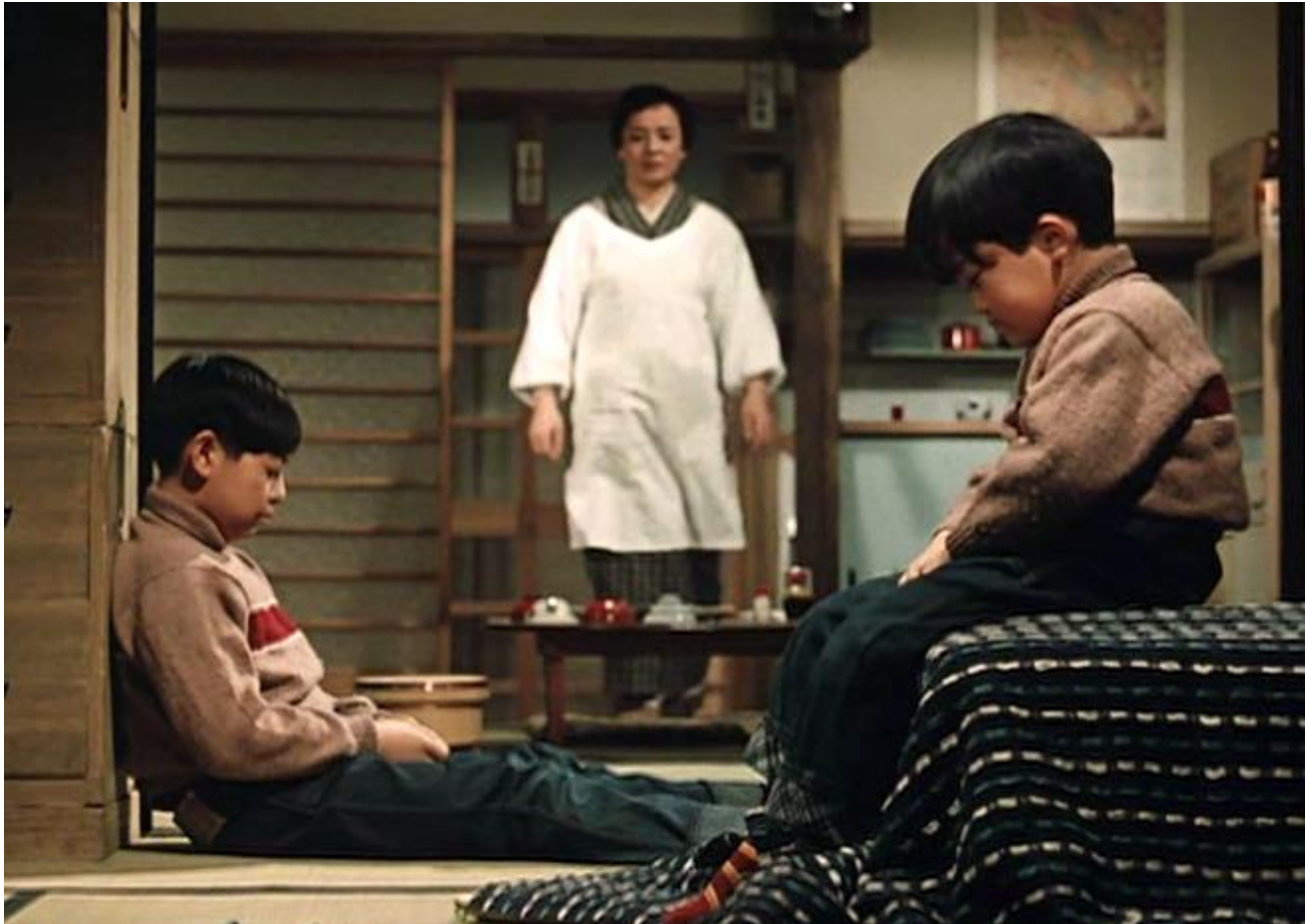
Fotograma de Bom Dia (1959), de Yasujirô Ozu.