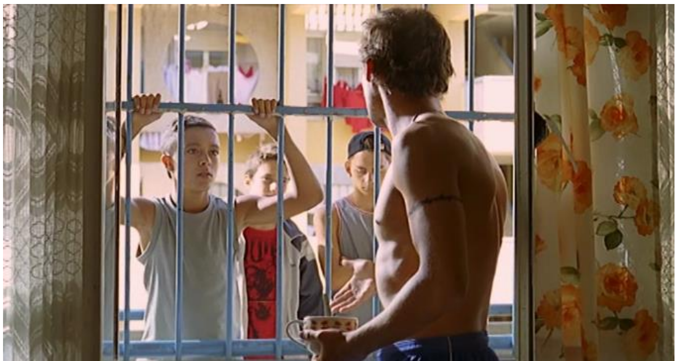
Fotogramas de Aniki-Bóbo (1942), de Manoel de Oliveira, e Arena (2009), de João Salaviza.