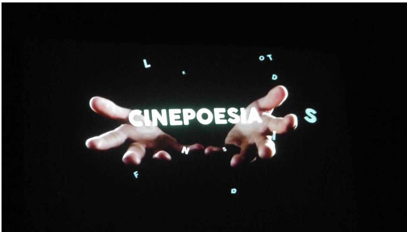
Imagem: fotograma do genérico da rubrica Cinepoesia (Associação AO NORTE)