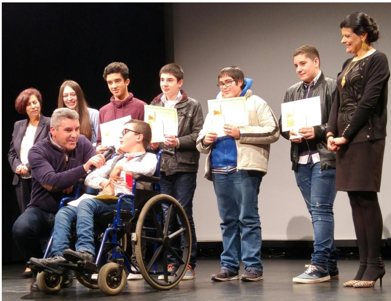
Entrega de Prémios de mérito aos alunos do AE Rodrigues Sampaio, Esposende, 12 de janeiro de 2018.