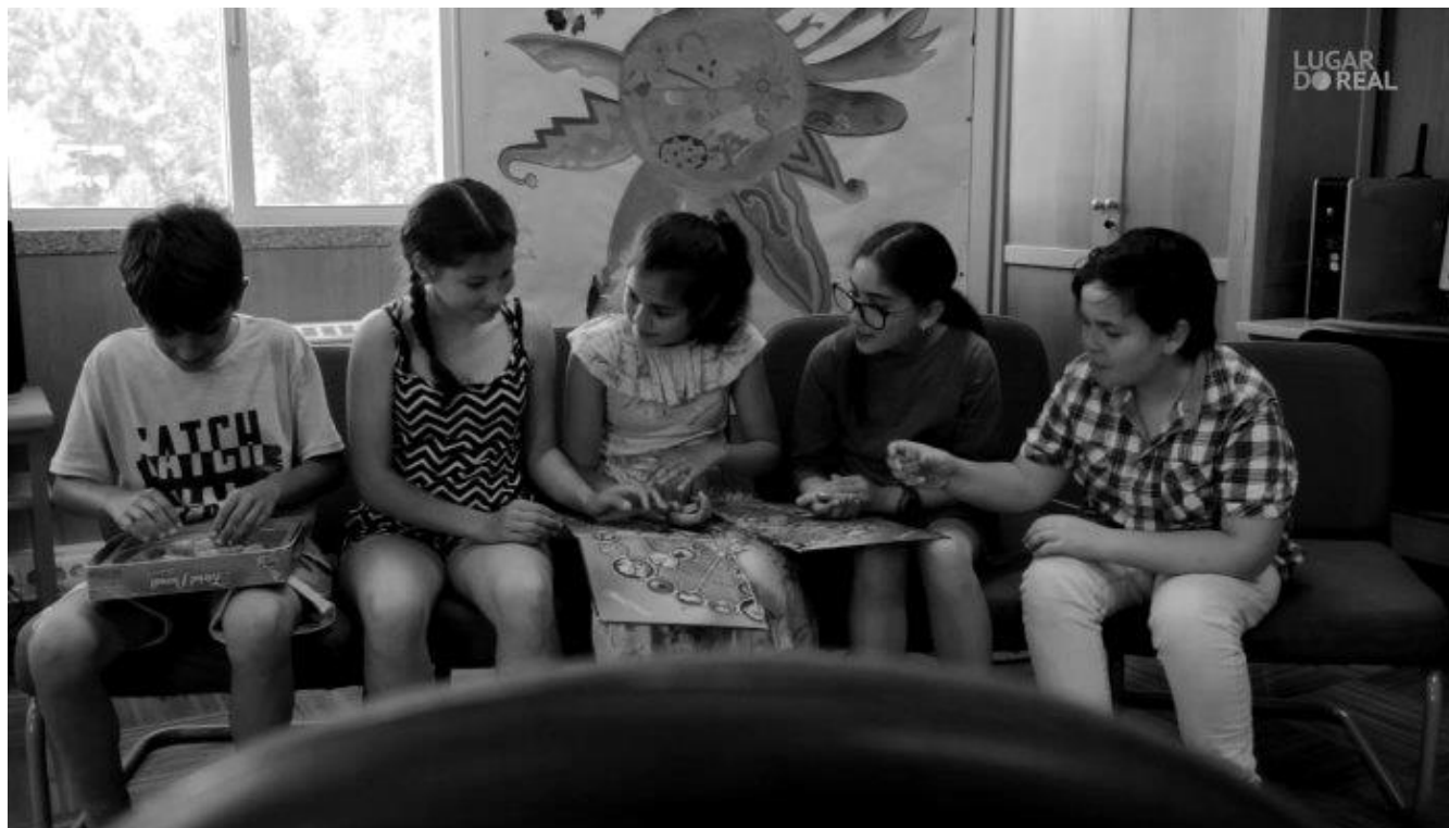
Fotograma de curta-metragem realizada pelos alunos do 6.º A do AE Rodrigues Sampaio, Esposende, 2017.