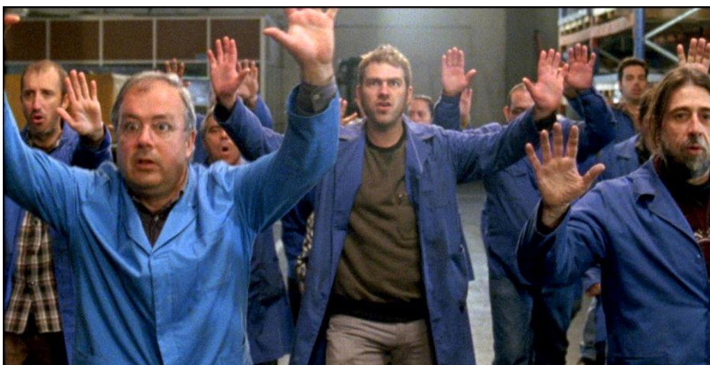
Imagens: Sessão de Cinema no Cineclube de Santarém, novembro 2017; fotograma de A Fábrica de Nada .