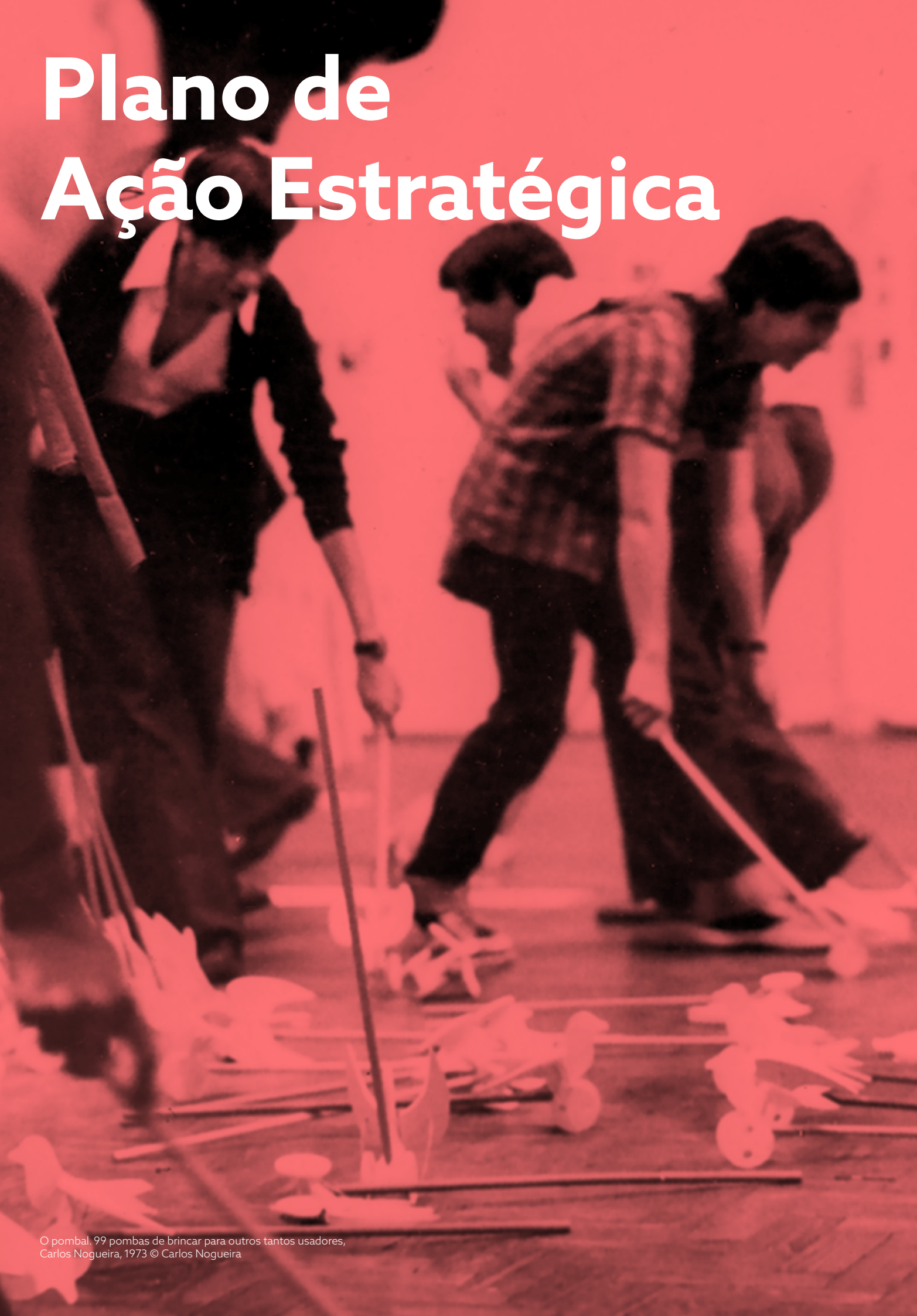
O pombal. 99 pombas de brincar para outros tantos usuários, Carlos Nogueira, 1973 © Carlos Nogueira