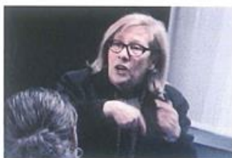
São José Lapa