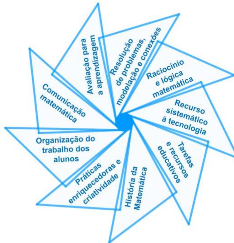
Figura 1 - Ideias chave das Aprendizagens Essenciais

As Aprendizagens Essenciais de Matemática no Ensino Secundário dão continuidade às aprendizagens do Ensino Básico e assumem um conjunto de princípios e orientações metodológicas, cuja concretização e especificação é feita para cada ano de escolaridade e tema matemático. A seguir, enunciam-se e apresentam-se as nove ideias chave preconizadas nas Aprendizagens Essenciais, esquematizadas na Figura 1: