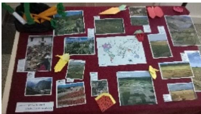
Diferentes tipos e práticas agrícolas no mundo