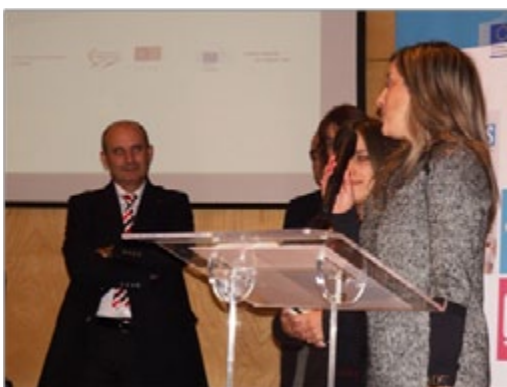
Agrupamento de Escolas de Vilela

No dia 2 de dezembro, em Braga, decorreu a entrega dos Prémios do Concurso dos Clubes Europeus 2013/14, durante a Conferência Nacional e-Skills . Os representantes dos três Agrupamentos premiados estiveram presentes.