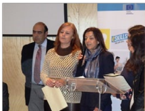
Agrupamento de Escolas Morgado de Mateus