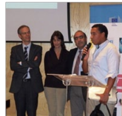
Agrupamento de Escolas Dr. António da Costa Contreiras